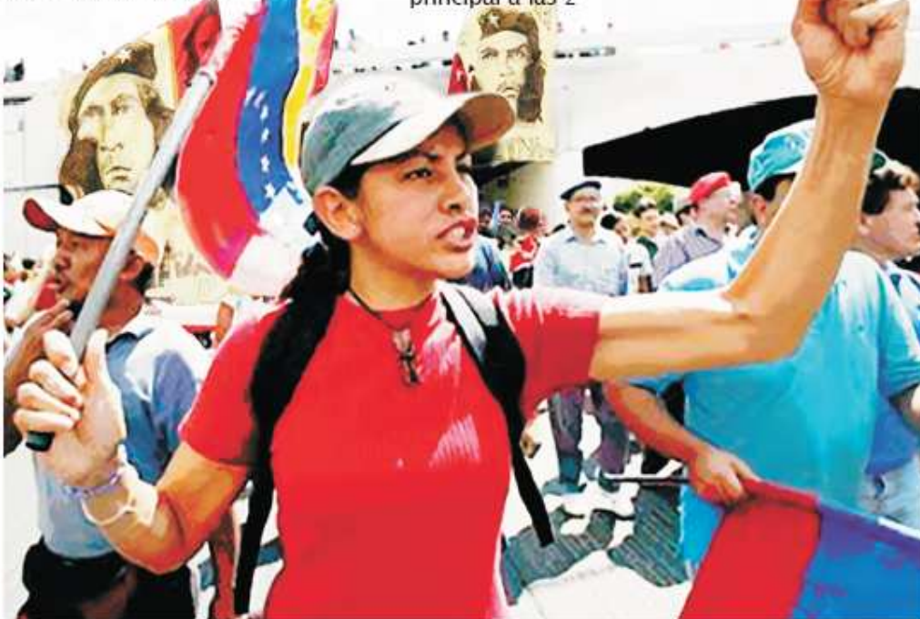
Mano de obra donata

COALICIÓN MANOS FUERA DE VENEZUELA Y CUBA DEL 20 DE MAYO